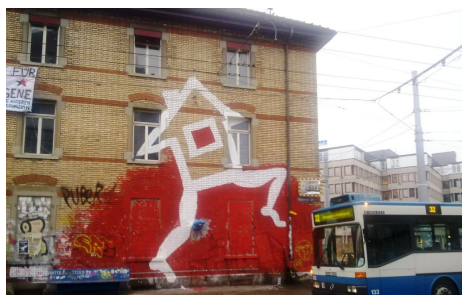
Zwei gesprayte Bilder aus unserem Arbeitsgebiet ...

Dieses „Haus in Bewegung“ ist Sinnbild für das, was wir auf den Strassen machen. Wir wollen uns nicht bequem niederlassen, sondern immer wieder Neues wagen, Grenzen überwinden und neue Herausforderungen annehmen! Die Arbeit nimmt zu und weitet sich aus. Andere Menschen werden davon angesteckt und wollen